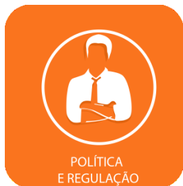
POLÍTICA E REGULÇÃO